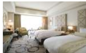
オーシャンビュールーム(40㎡)

Point 4 寛ぎ!! ホテル館内「SPA然TOKYO」の各種トリートメントが10%OFFに!!