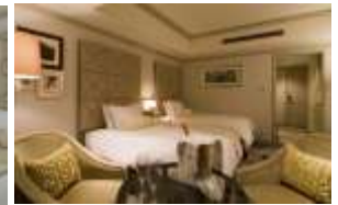
パークビュールーム(33㎡)